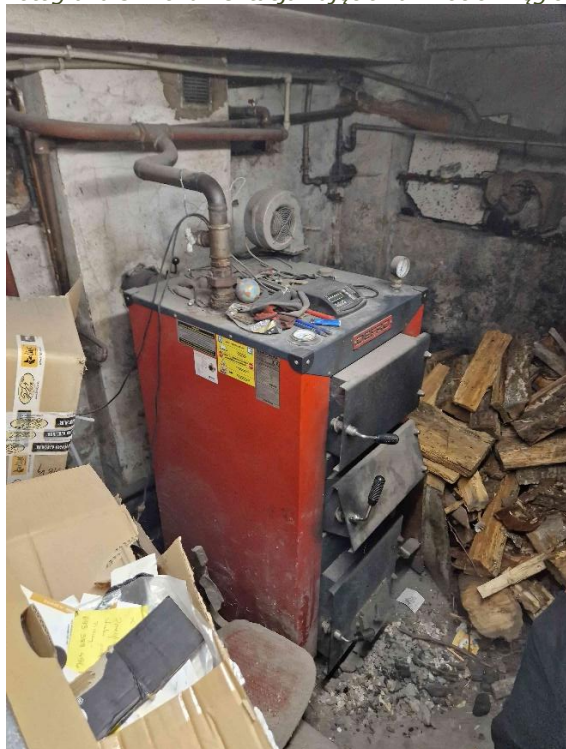
Fotografia 3. Dokumentacja zdjęciowa - kocioł węglowy

Projektowane obciążenie cieplne budynku wynosi 24,731 kW.