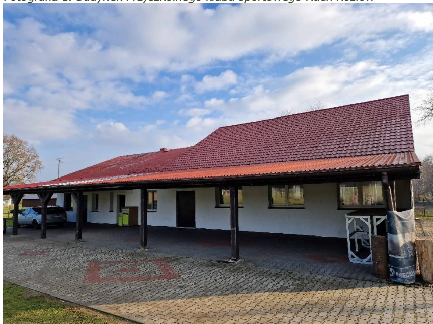
Fotografia 1. Budynek Przyszkolnego klubu sportowego Ruch Kozłów