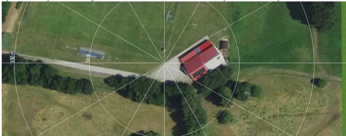
Rysunek 4. Proponowane miejsca rozmieszczenia modułów fotowoltaicznych na dachu budynku